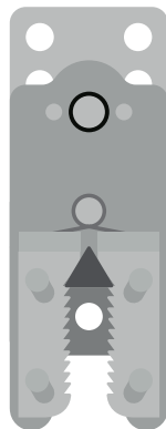
Connecteur et plaque métallique SOLIDAIRES